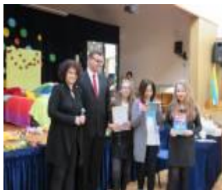
Uczniowie ze Szkoły Podstawowej w Kunowie - zwycięzcy konkursu „Licz się ze słowami”